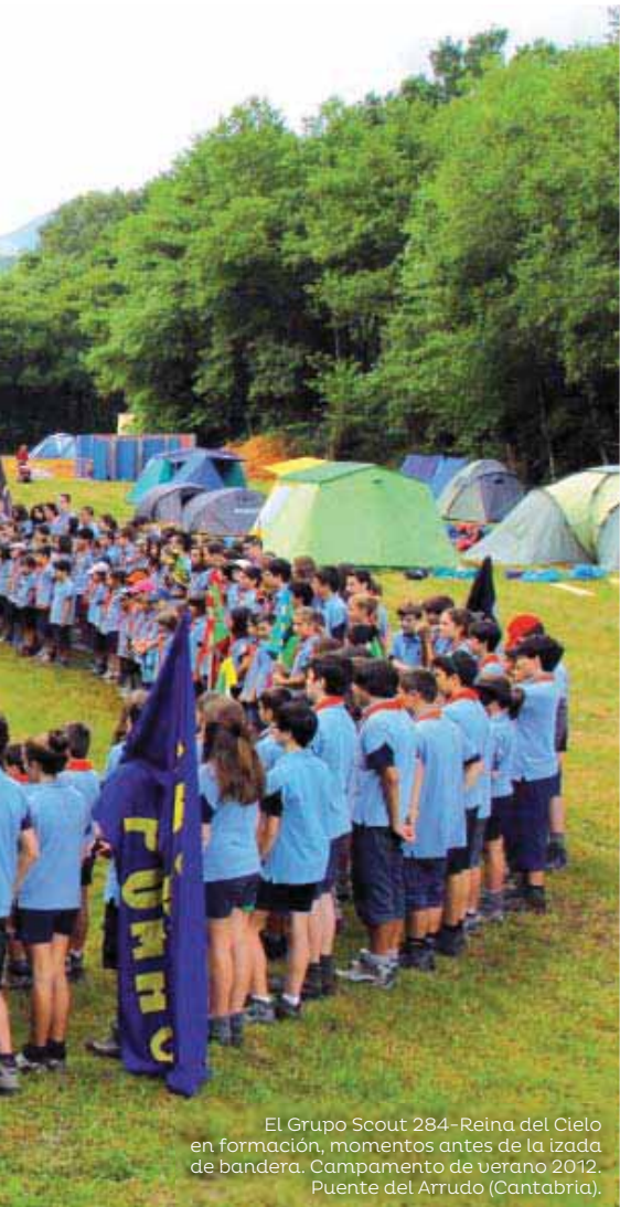
El Grupo Scout 284-Reina del Cielo en formación, momentos antes de la izada de bandera. Campamento de verano 2012. Puente del Arrudo (Cantabria).