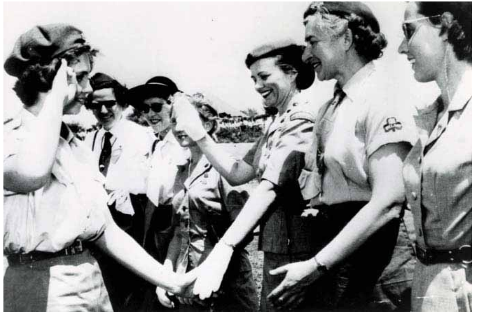
La Reina Sofía perteneció al movimiento Guías en su adolescencia. En la imagen, realiza el saludo scout.

El propio Baden-Powell destacó por la heroica defensa que hizo de Mafeking durante 217 días en el transcurso de la Guerra de los Boers, un valiente comportamiento que le sirvió en bandeja el ascenso a general. Educado en el elitista Chaterhouse