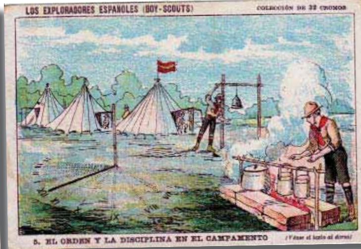
Cromos pertenecientes a dos colecciones de 1916 en los que se detallaba el día a día de un campamento.

No le falta razón. Después de la gran reputación que gozó en los primeros años, bajo el abrigo del propio Alfonso XIII, que en 1917 acepta la presidencia de honor de los Exploradores de España, un año después de que finalizara la Guerra Civil, Franco prohibió las actividades de los exploradores. La clandestinidad facilitó la desintegración del escultismo nacional, provocando la fragmentación y no fue hasta finales de los años 50, y gracias al incondicional apoyo de muchas parroquias, cuando resurge. La entrada de la Iglesia supone una normalización para un movimiento que en más de una ocasión ha sido denominado como escuela de líderes.