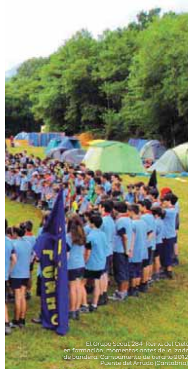
El Grupo Scout 284-Reina del Cielo en formación, momentos antes de la izada de bandera. Campamento de verano 2012. Puente del Arrudo (Cantabria).

actividades al aire libre, proyectos de cooperación y servicio a la sociedad. En el último mensaje de Baden-Powell, encontrado entre sus efectos personales y considerado su testamento scout, aconsejaba a todos los jóvenes que "un paso hacia la felicidad es hacerse sano y fuerte de niño, para poder ser útil y así poder gozar de la vida cuando se es hombre. Estén satisfechos con lo que les haya tocado y saquen de ello el mejor partido que puedan. Vean siempre el lado bueno de las cosas y no el malo".