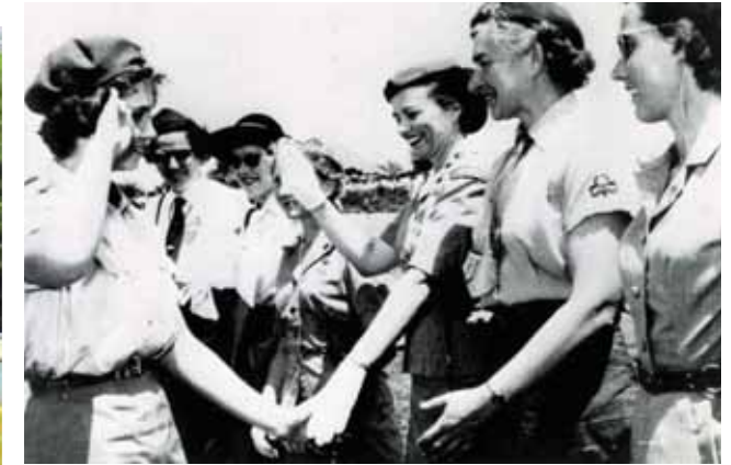
La Reina Sofía perteneció al movimiento Guías en su adolescencia. En la imagen, realiza el saludo scout.

School de Londres ingresó en el ejército británico en 1876, donde tuvo la oportunidad de desarrollar sus revolucionarios métodos desde Afganistán a Sudáfrica, que, más tarde, trasladaría a la organización a la que se dedicaría por entero a partir de 1910, año en el que decidió retirarse del ejército activo. Los Boy Scouts se estructuraron con un código de conducta moral muy próximo al militar, pero prefirió dejar en manos de su hermana Agnes la creación de la rama femenina, las Girl Guides.