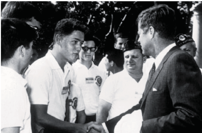
Los presidentes de EE UU, excepto Reagan, han practicado el escultismo. En la imagen, Bill Clinton saluda a JFK.

Rupérez, que al igual que Aznar fue scout mientras cursaba estudios en la madrileña y marianista escuela de El Pilar, tuvo una experiencia similar a la de la secretaria general del PP. "Tenía unos 12 años y entré dirigiendo algunas actividades", señala al recordar que en aquella época empezaba a aceptarse en España a los scouts, "hacia los cuales había existido una cierta desconfianza".