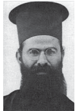
Beato Kamen Vitchev

Todos estamos invitados a interesarnos y a participar en esos diversos actos.