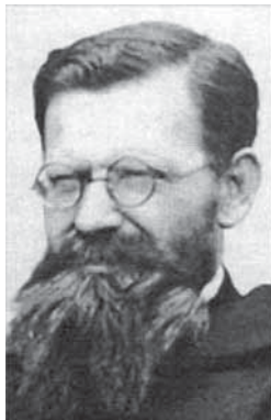
Beato Josaphat Chichkov