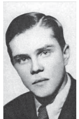
Beato Pavel Djijov