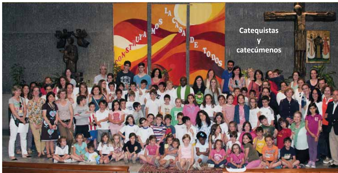
Catequistas y catecúmenos