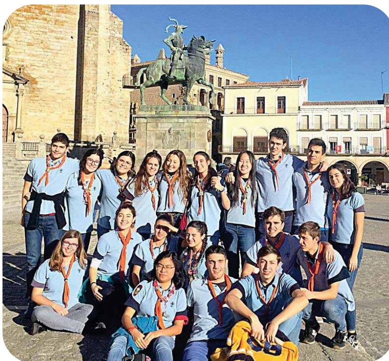
Grupo de jóvenes en la plaza Mayor, antes de su marcha de Trujillo.